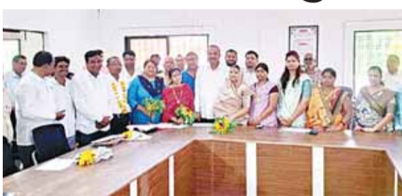
हरिभूमि न्यूज ॥ सौसर

नगर पालिका परिषद सौसर के सभाकक्ष में शुक्रवार को परिषद का विशेष सम्मेलन आयोजित किया गया। इस बैठक में विकास कार्यों के गति देने के लिए आगामी वित्तीय वर्ष का बजट प्रस्तुत किया गया, जिसे सदन ने सर्वसम्मति से पारित कर दिया। साथ ही, शासन द्वारा मनोनीत नए पार्षदों का नागरिक अभिर्नंदन भी किया गया। बैठक की शुरुआत में शासन द्वारा मनोनीत पार्षदों के स्वागत का कार्यक्रम हुआ।